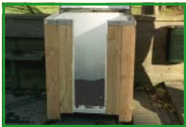
Start af kompostbeholderen

Ved start af en ny kompostbeholder er det en god idé at lægge et lag råkompost i bunden.