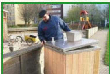
Låget hængsles af beholderen

Luften skiftes vha. åbninger i bunden og en skorsten på låget. Ilten fremmer komposteringsprocessen og mindsker lugtgener.