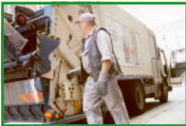
Skraldemand i arbejde

Vi bliver rigere både på penge og på affald. Godt \frac{1}{3} af husholdningsaffaldet er organisk og kan nedbrydes naturligt ved kompostering.