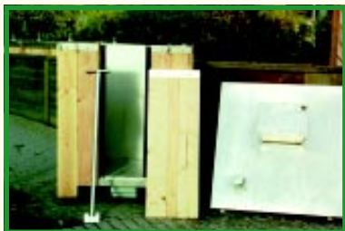
Den skilte beholder

Nørrebro Storbykomposten er en varmkompostbeholder specielt udviklet til byen. Den er beregnet til 15 - 20 familier.