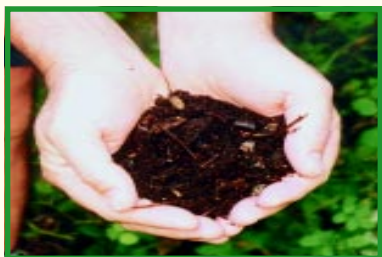
Den færdige råkompost

Perkolatskuffen tømmes efter behov. Perkolatet gemmes til der er behov for at bruge det som gødning.