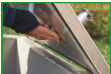
Skorsten og spjæld

Beholderen er fremstillet i rustfrit stål, beklædt med douglasgran. Den har perkolatskuffe og kan flyttes med en palleløfter.