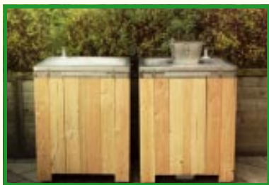
Nørrebro Storbykomposten med og uden påfyldningslåg

Nørrebro Storbykomposten er en varmkompostbeholder specielt udviklet til byen. Den er beregnet til 15 - 20 familier.