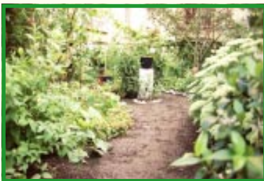
En have på Indre Nørrebro

Værdien ligger i det høje indhold af humus - muld - som har en stor betydning for tilførsel af næringsstoffer til jorden.