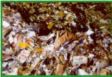
Restaffald på forbrændingsanlæg

Vi bliver rigere både på penge og på affald. Godt \frac{1}{3} af husholdningsaffaldet er organisk og kan nedbrydes naturligt ved kompostering.