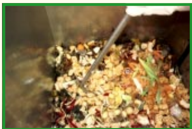
Komposten findeles og vendes

Ved start af en ny kompostbeholder er det en god idé at lægge et lag råkompost i bunden.