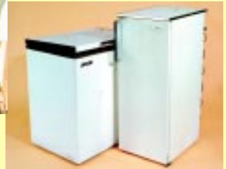
Køle- & fryseskabe