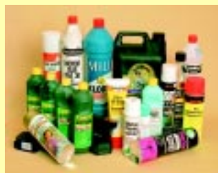
Olie- & kemikalierester